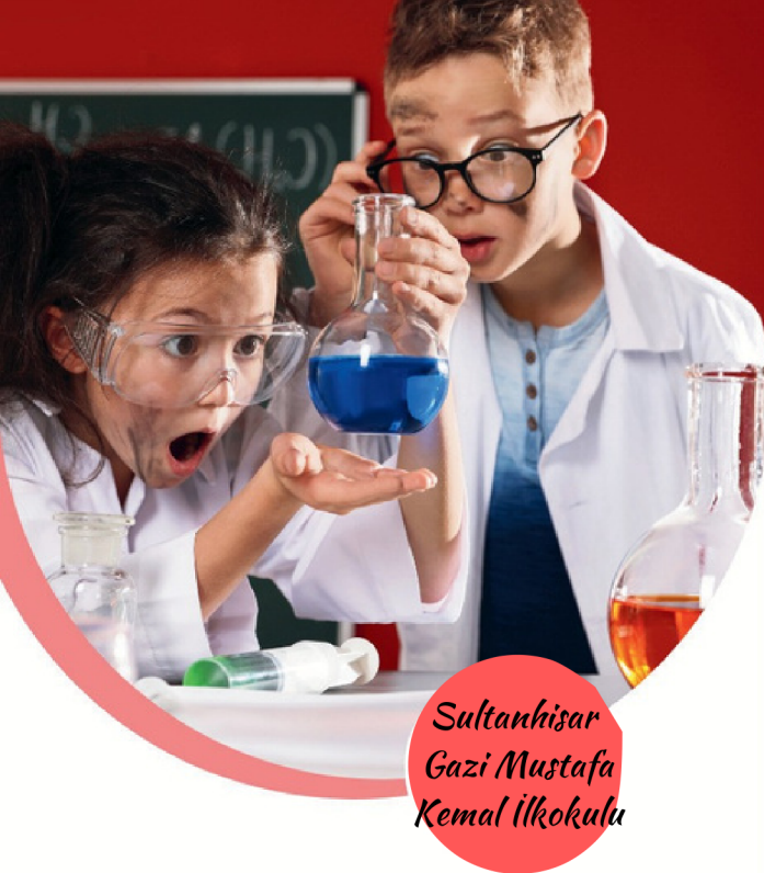
Sultanhisar Gazi Mustafa Kemal İlkokulu